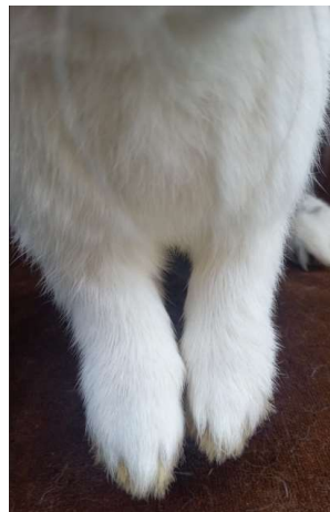
jednobarevné obě hrudní končetiny (-1b)