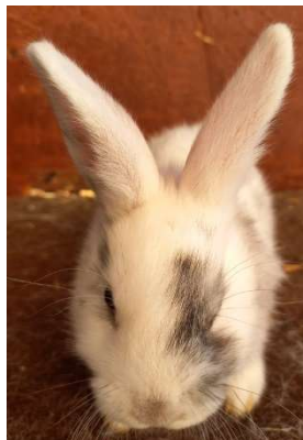
Jednobarevné uši (výluka)