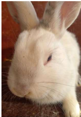
jednobarevná hlava (výluka)