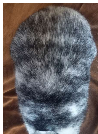
celkově tmavší kresba (-1b)