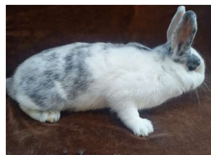
více než 1/4těla bez kresby (výluka)