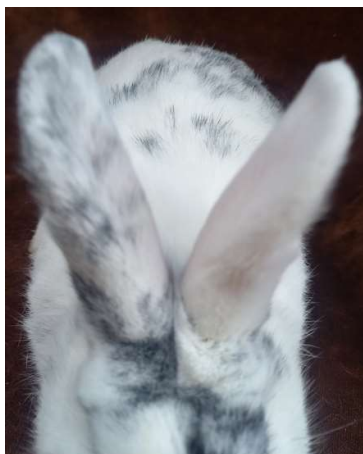
jednobarevné ucho (-1b)