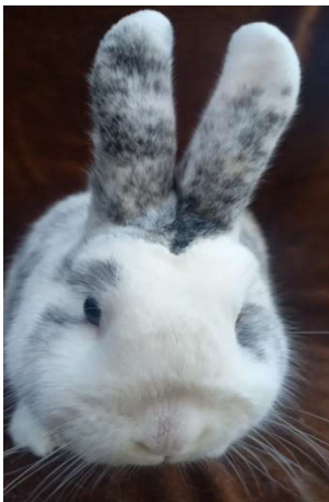
světlejší kresba hlavy (-1 b)