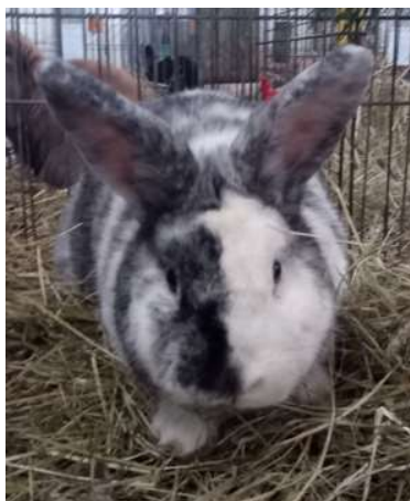
půlená kresba hlavy (-1b)