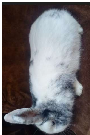
celkově světlejší kresba na těle (až -3b)